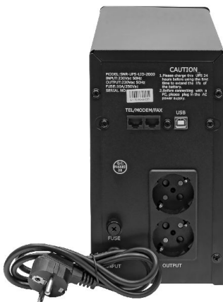
Рисунок 2 - Общий вид задней панели ИБП

Общий вид задней панели источника бесперебойного питания представлен на рисунке 2.